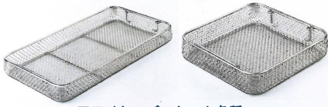
■ワイヤーバスケット各種 ※コンテナのサイズに合わせて ご提案させていただきます